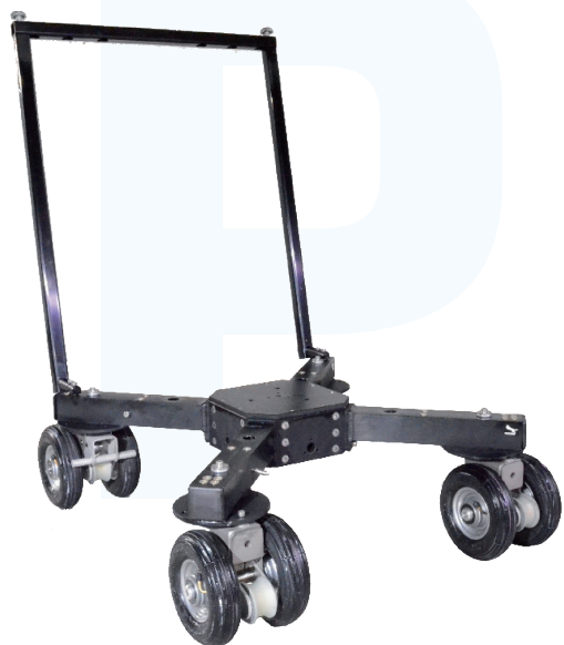
P1 Dolly + BasePlate + Track Wheel Set

P1 Dolly has a capable steering system with front-, rear-, and crab/freestyle steering.