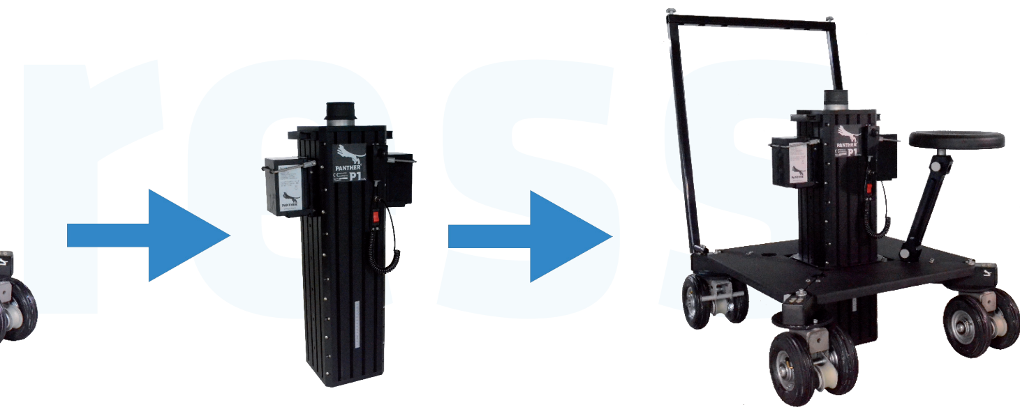
+ P1 Column/Säule

... is compact in size (20x20cm/8x8") and extremely low in weight (29kg/65lbs).