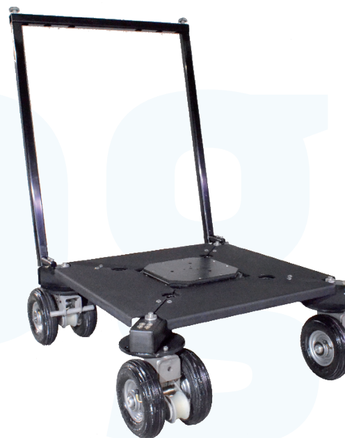
+ Platform Set

Panther konstruierte einen kostenbewussten, elektrischen Dolly für alle HD Kameras - von DSLR bis Alexa, RED, Sony etc. Die Das Antriebskonzept wurde vom Panther Classic übernommen.